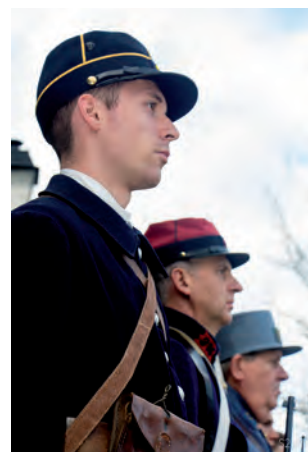
La commémoration a débuté dans le Bourg, au Monument aux Morts, avec notamment un dépôt de gerbes, la lecture du message du Secrétaire d'État chargé des Anciens combattants, de la chanson de Craonne au violon et de la traditionnelle minute de silence.