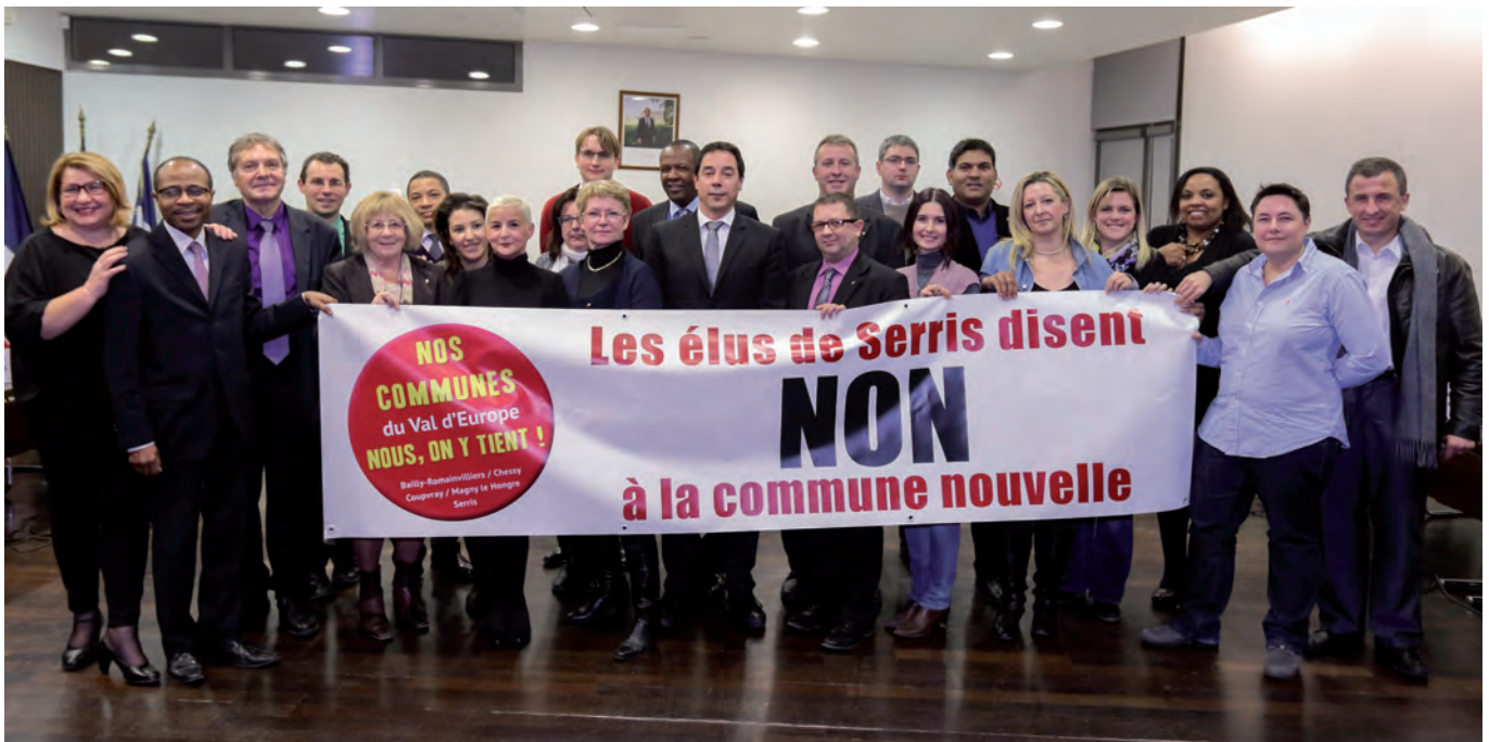
Les Élus de Serris unis suite au vote contre la création d'une commune nouvelle lors du conseil municipal du 15 décembre dernier.

Les élus de Serris, se sont prononcés à l'unanimité, contre le projet de commune nouvelle que souhaitent nous imposer nos voisins. Attachés à notre commune, son histoire et ses spécificités : Nous, Serris, on y tient !