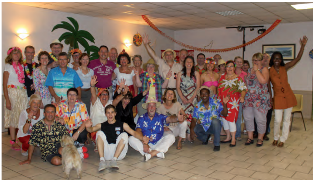
Le samedi 28 juin 2014, Serris Balad organisait son Assemblée Générale suivie d'une soirée festive, avec les Antilles comme thème : l'exemple concret de la convivialité !

La balade est un moyen de se détendre, de prendre le temps de découvrir et d'échanger. Il s'est créé un fort lien entre les adhérents. L'ambiance dans notre association est chaleureuse et sans prétention.