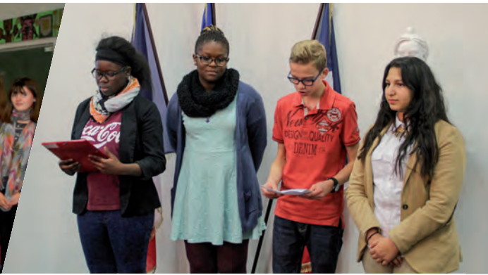
Les délégués de classe avaient préparé un discours pour parler de leur engagement et remercier les élus de les avoir conviés à cette réception.