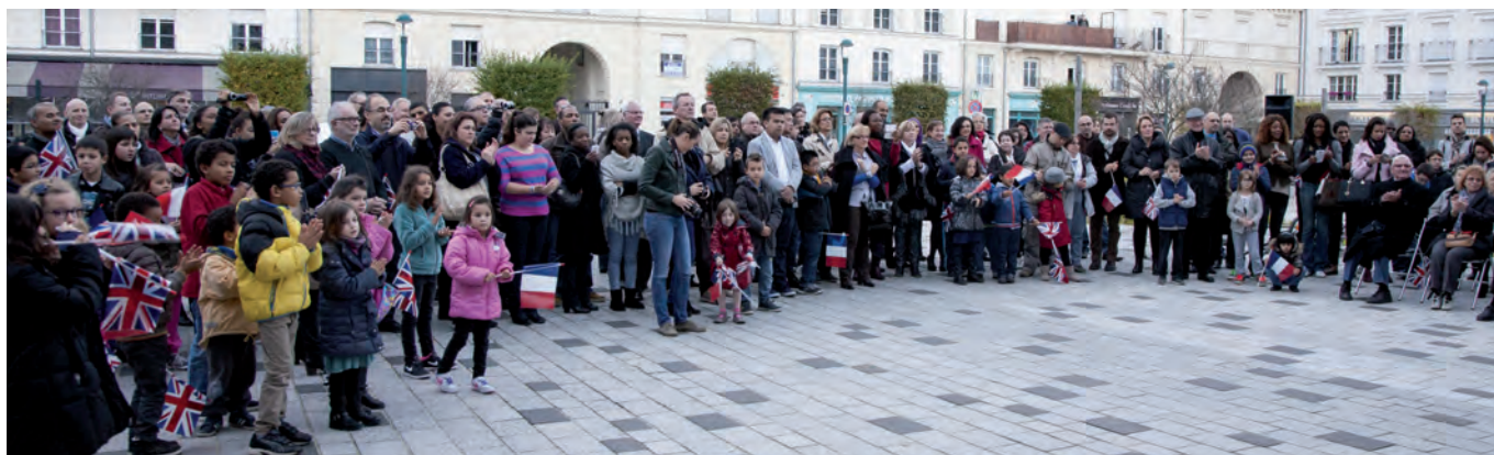
De très nombreux Serrisais sont venus participer à cette commémoration de l'Armistice de 1918, que ce soit dans le Bourg ou dans le centre urbain.