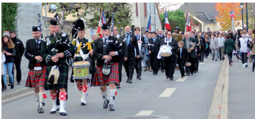
La fanfare et le groupe de cornemuses Iron Piper (en hommage aux soldats britanniques morts pendant ce conflit) ont apporté une note musicale appréciée à cette commémoration.

La commémoration de l'Armistice du 11 novembre fut le point d'orgue de cette année: défilé, Marseillaise par la chorale de l'EPIDE, hommage aux troupes britanniques par le groupe Iron Piper, personnages en tenues militaires d'époque, dépôt de gerbes