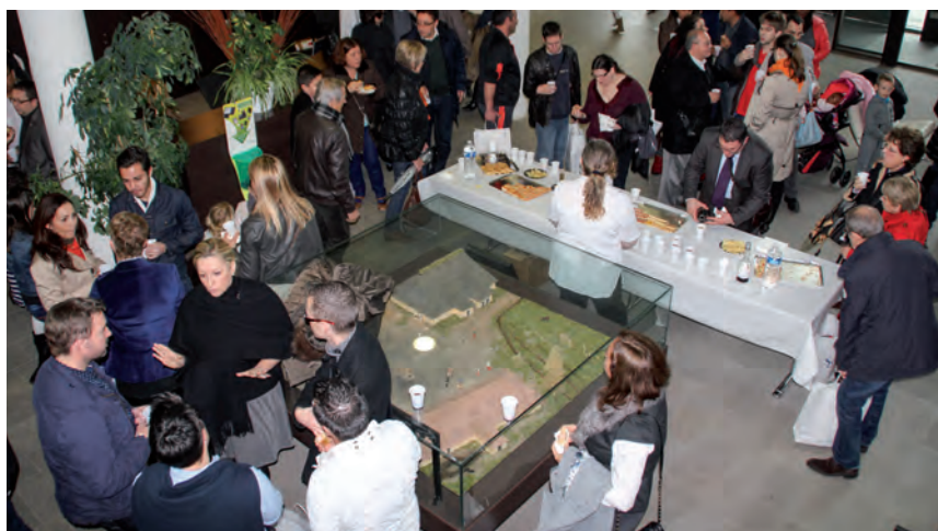
Le cocktail a permis de continuer les échanges