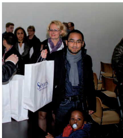
Les nouveaux Serrissiens ont reçu un cadeau gourmand à l'issue de cette rencontre