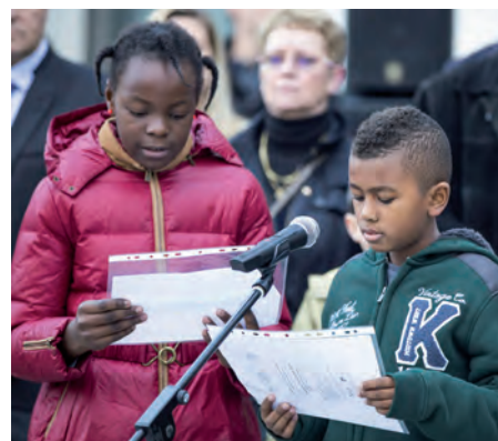
À la demande des élus, les enfants des 4 groupes scolaires ont lu des lettres de poilus.