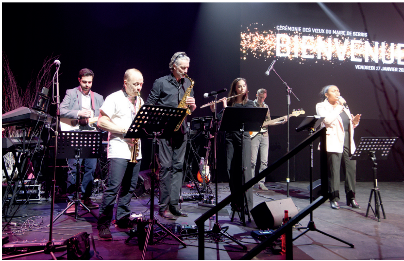
▲ L'école de Musique Serrissienne a ouvert la cérémonie