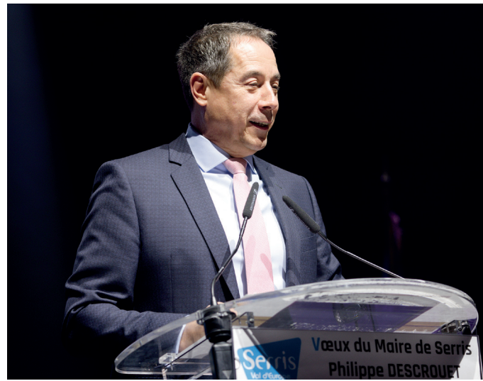
▼ Institutionnels et Serrissiens avaient répondu présents